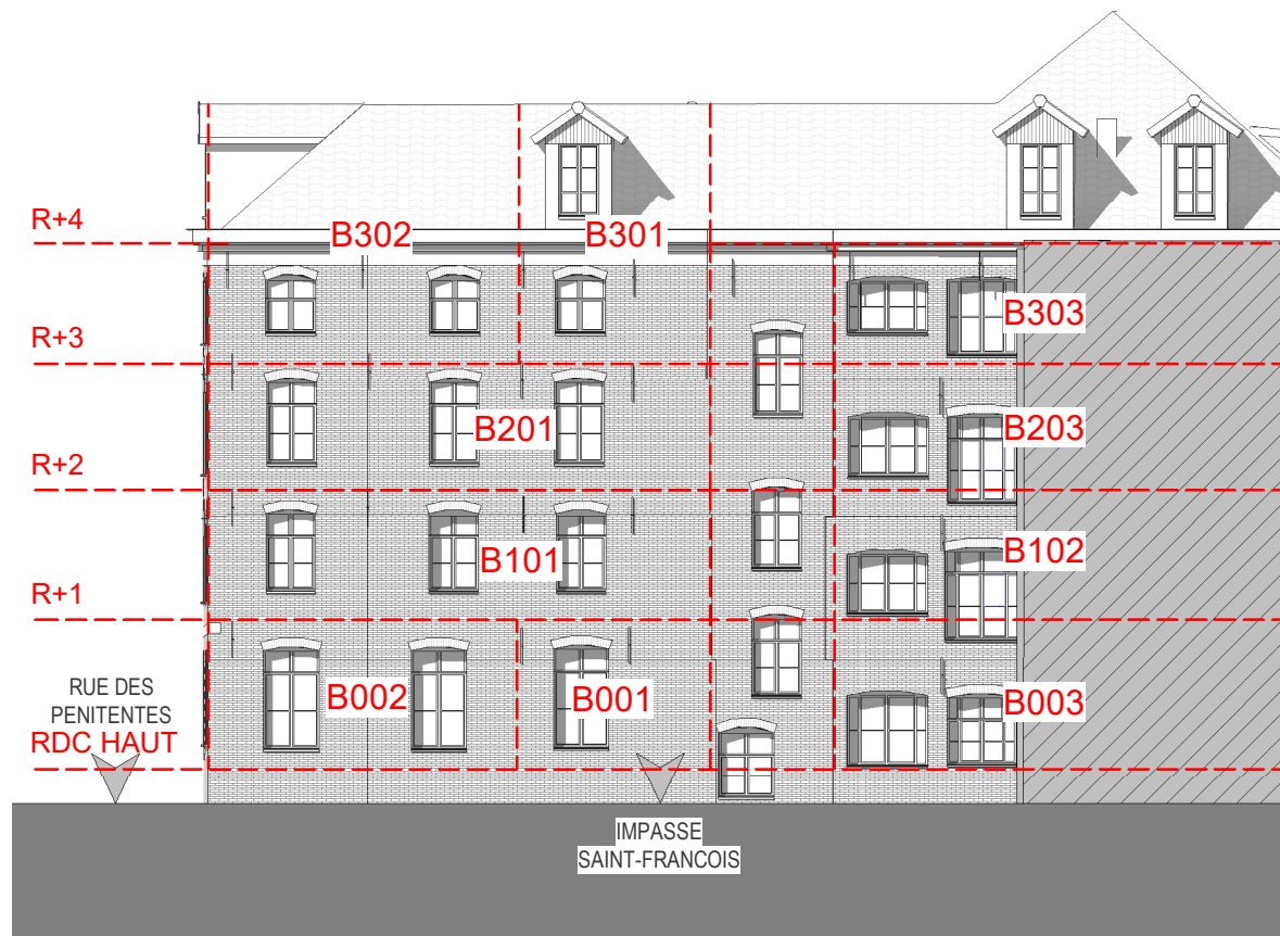
ELEVATION NORD-OUEST Bâtiment B - Côté Cour Extérieure

NOTA : Le présent plan exprime les dispositions générales du lot. Celles-ci sont susceptibles de validation en fonctions des nécessités techniques et sous réserve d'accords des services d'urbanisme et de l'architecte des bâtiments de France (UDAP) ainsi que des services de la DRAC.