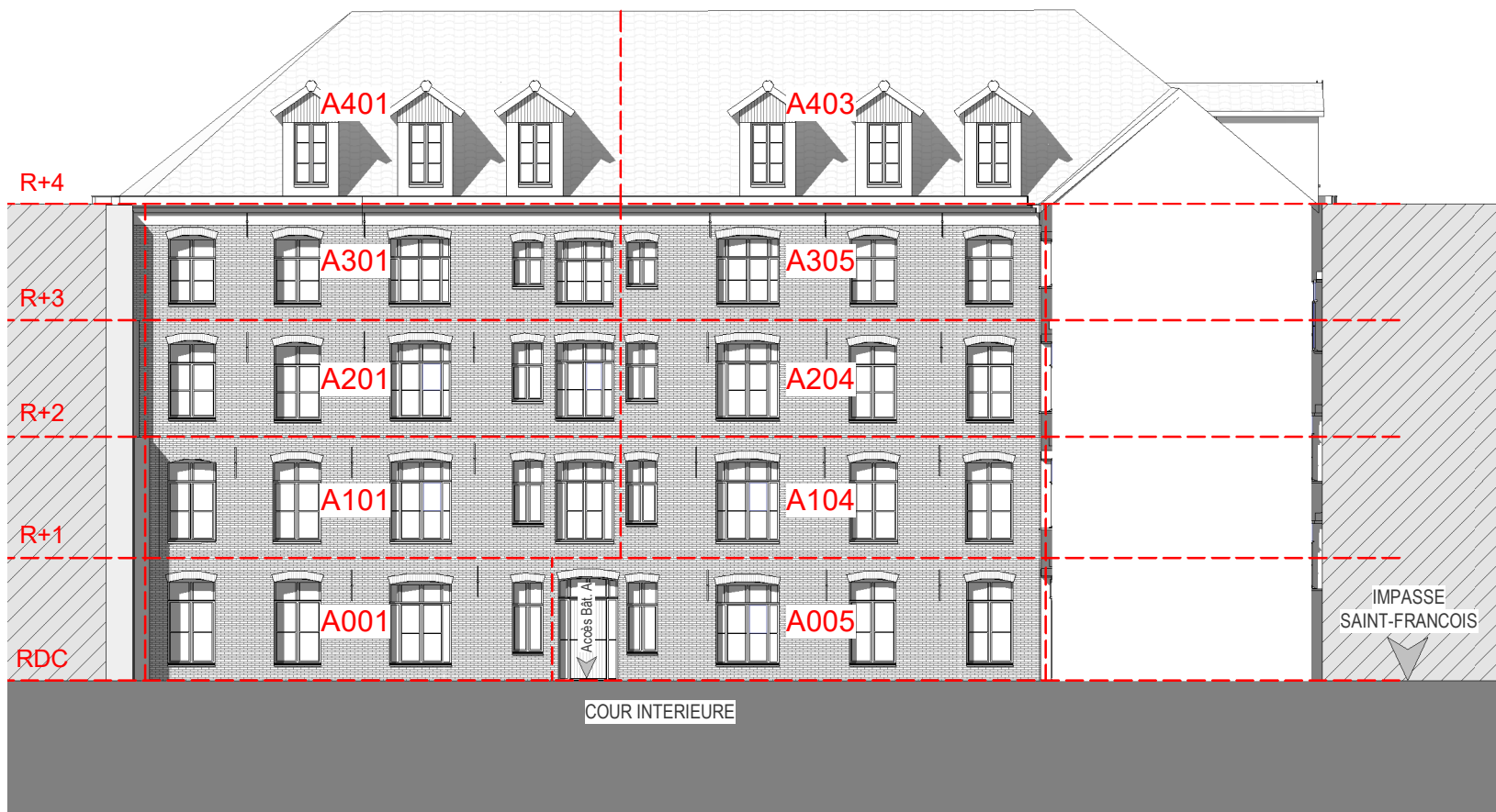
ELEVATION NORD-EST Bâtiment A Côté Cour Intérieure

NOTA : Le présent plan exprime les dispositions générales du lot. Celles-ci sont susceptibles de validation en fonctions des nécessités techniques et sous réserve d'accords des services d'urbanisme et de l'architecte des bâtiments de france (UDAP) ainsi que des services de la DRAC.