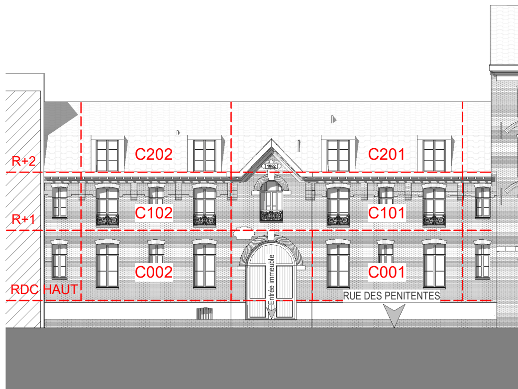
ELEVATION NORD-EST Bâtiment C Côté rue des Pénitentes

NOTA : Le présent plan exprime les dispositions générales du lot. Celles-ci sont susceptibles de validation en fonctions des nécessités techniques et sous réserve d'accords des services d'urbanisme et de l'architecte des bâtiments de france (UDAP) ainsi que des services de la DRAC.