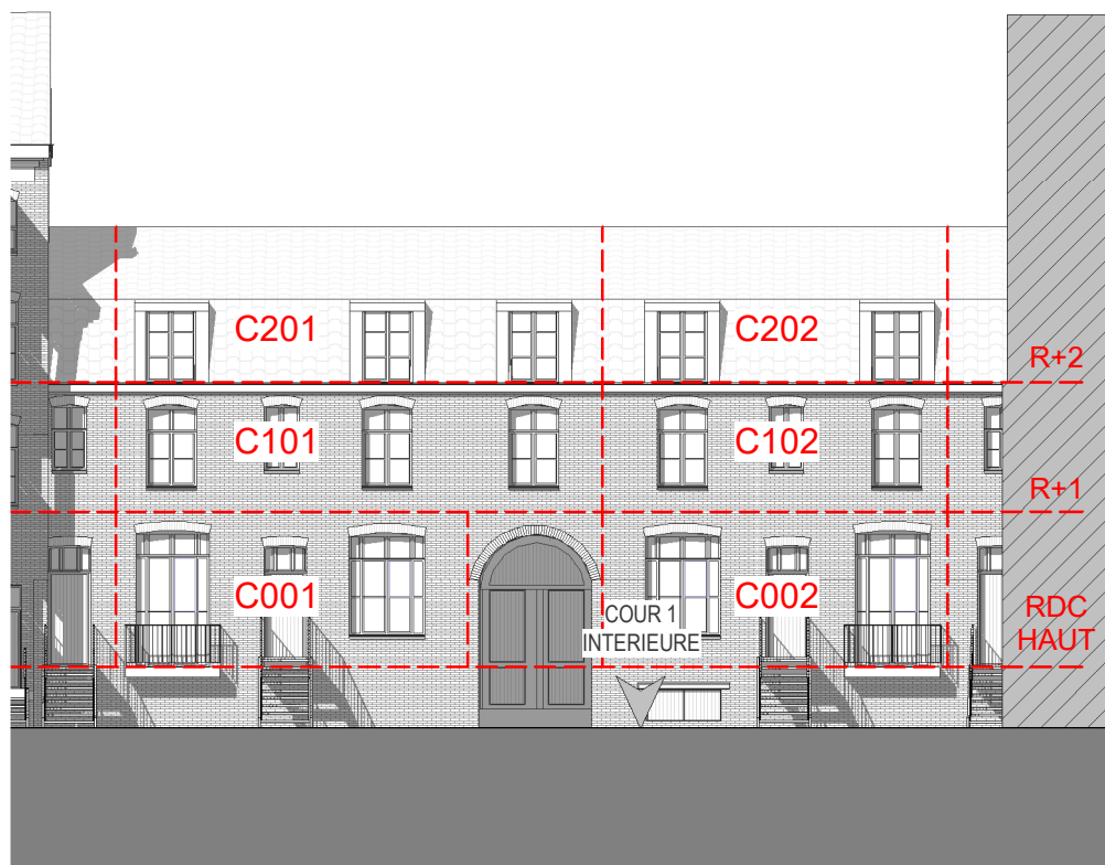
ELEVATION SUD-OUEST Bâtiment C Côté Cour Intérieure

NOTA : Le présent plan exprime les dispositions générales du lot. Celles-ci sont susceptibles de validation en fonctions des nécessités techniques et sous réserve d'accords des services d'urbanisme et de l'architecte des bâtiments de France (UDAP) ainsi que des services de la DRAC.